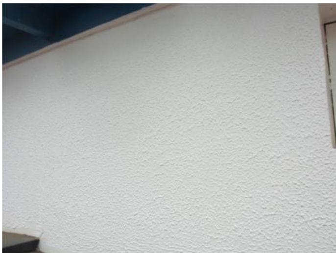
小壁パターン完了