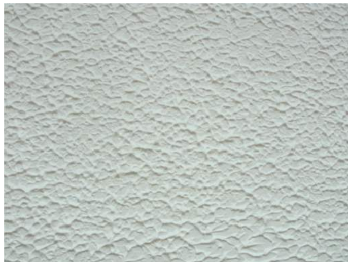
小壁パターン完了